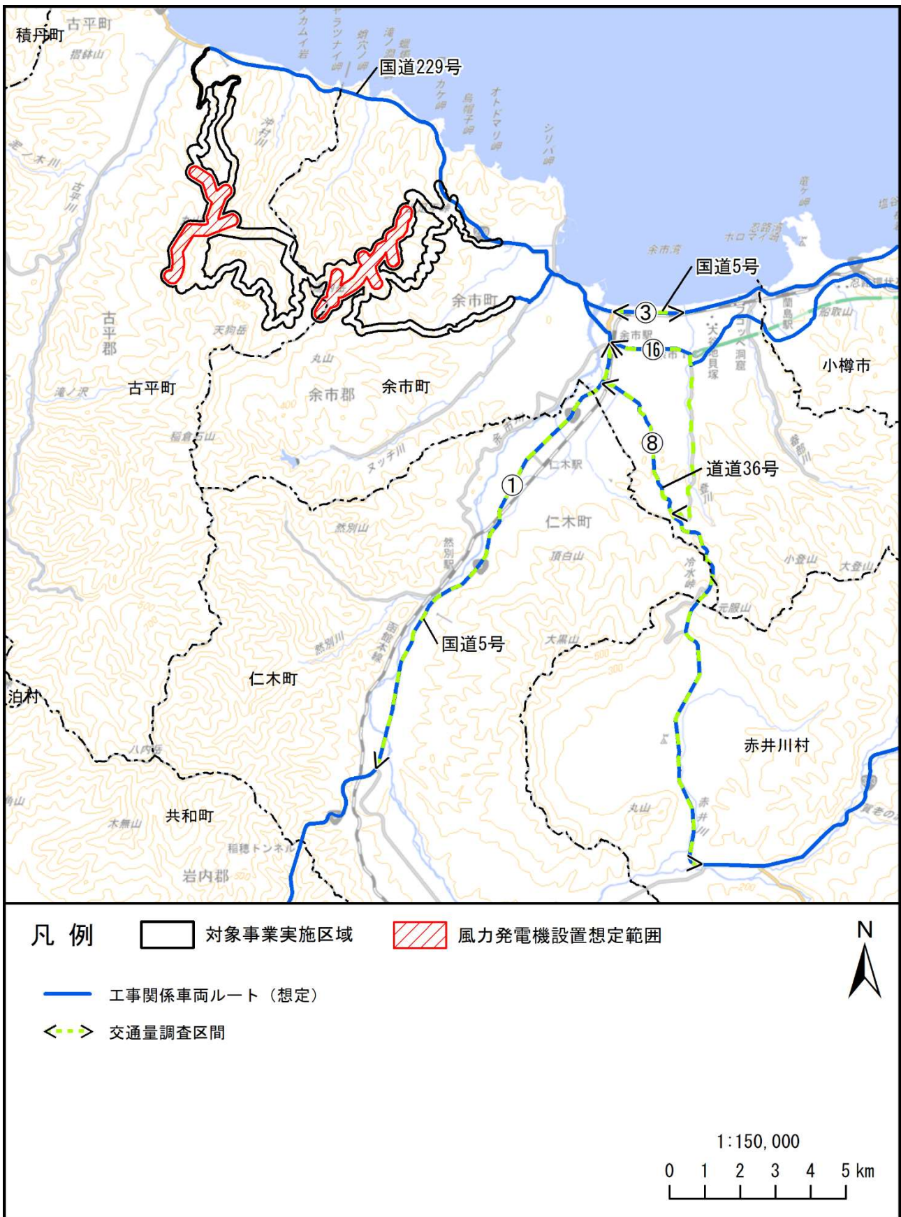
図 「調査区間」と「工事関係車両の主要な走行ルート」との重複状況